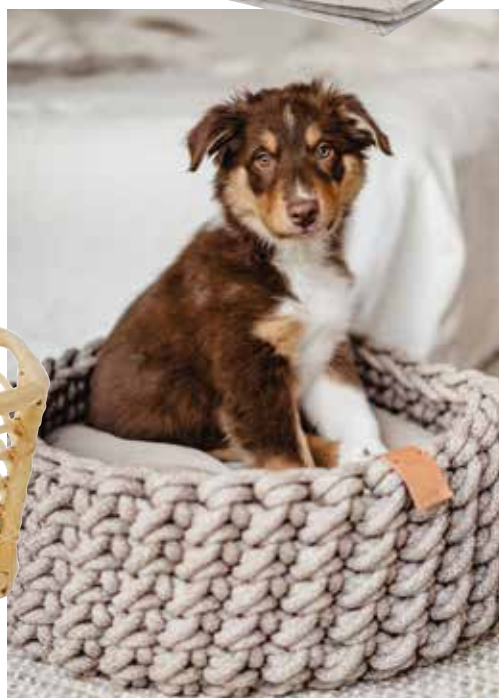
Der Hundekorb „Linz“ von Hunter überzeugt mit seiner edlen, anpassungsfähigen Optik. Er besitzt ein wendbares Innenkissen und garantiert maximale Hygiene, da sich der Bezug waschen lässt. Durchmesser 50 cm, ca. 100 Euro.