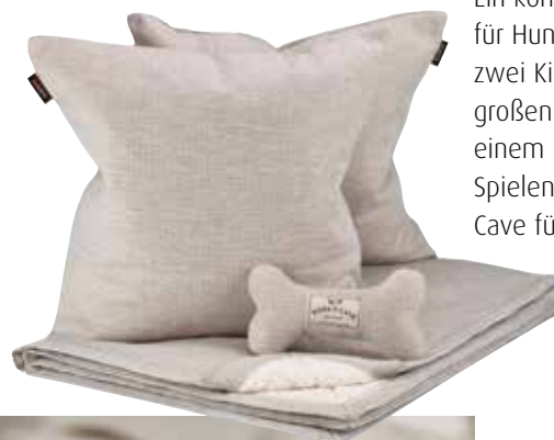
Ein komplettes Wohlfühl-Set für Hunde, bestehend aus zwei Kissenbezügen, einer großen Kuscheldecke und einem Plüschknochen zum Spielen, gibt es von Kona Cave für 149 Euro.