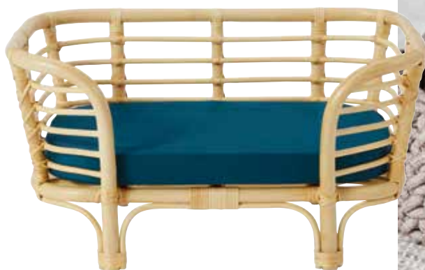
Sitzgelegenheit mit ländlichem Charme: das Tierbett „Rattan“. Der Boho-Holzrahmen mit gemütlichem Sitzkissen lässt Ihr Haustier stilvoll schlafen. Von Made, ca. 115 Euro.