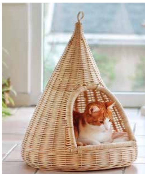
Der geflochtene Katzenkorb fügt sich harmonisch ins ländliche Interieur ein. Über Otto, 54,99 Euro.

Auch unsere liebsten Begleiter brauchen einen Rückzugsort. Wie gut, dass es heutzutage Haustiermöbel gibt, die sich großartig mit dem schönen Landhausstil kombinieren lassen. Lassen Sie sich überzeugen von unserer Auswahl für die besten Freunde des Menschen. Ihr Tier wird es Ihnen danken.