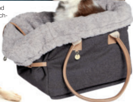
Tragetasche City Carrier Heather Brown für kleinere Hunde ist ideal für Ausflüge oder als mobiles Hundebett; ab 279 Euro, von Cloud 7