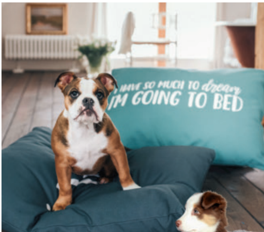
Auf dem Schlafkissen Keitum in Petrol und Anthrazit kann es sich Ihr Vierbeiner so richtig gemütlich machen; 80 Euro, Hunter