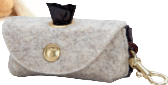
Mit dem Spender Doggy-Do-Bag aus Filz mit Karabiner sind Hundetüten elegant verpackt und stets griffbereit; 25 Euro, von Cloud 7