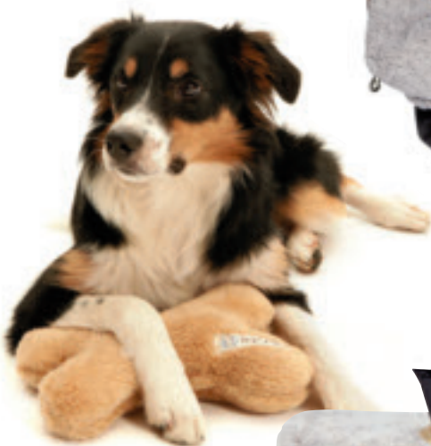
Der Kuschelknochen ist ein Kissen zum Schlafen und entlastet dabei die Halswirbelsäule des Hundes; 13 Euro, von Dog's Finest