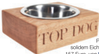
Personalisierbarer Hundenapf aus solidem Eichenholz mit Edelstahlschüssel; ab 157 Euro, von The Oak and Rope Company